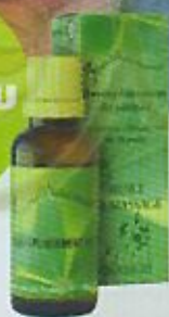
Assouplissement du périnée