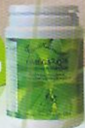
OMEGA 3 -Q 30